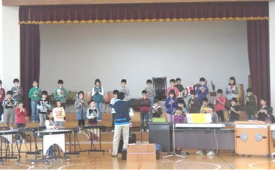
音楽会ステージ練習