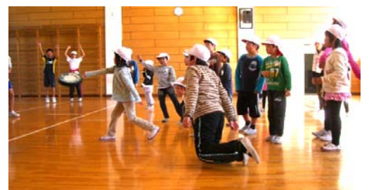
6年生と1年生の交流場面

本年度の本校の重点目標「ルールの確立に基づく、楽しく活発な集団づくり」の具現のため中核として位置づけた「おおらかタイム」の時間です。ご家庭でお子さんの話の中でも登場しているかもしれませんが、毎週水曜日は、一斉清掃をなしとしてこの時間をみんなで思い切り遊ぶ時間としています。学級や姉妹学級で遊びや活動の中身を考え、体をいっぱい動かして楽しむ時間でもあります。遊びの中で友だちと関わりながら「人間関係づくり」を学び合う時ともなります。また、心身を鍛え、健康で安全な生活を送れるようにするための大切な場として継続しながら、「おおらかタイム」を通じて体と心のさらなる健全な育ちを求めていきたいと思ひます。